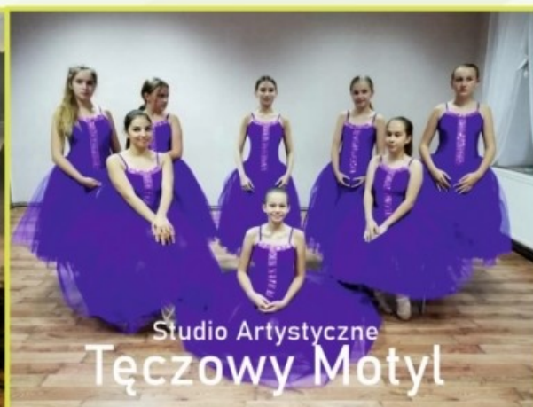
Studio Artystyczne Tęczowy Motyl