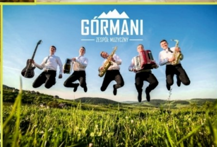
GÓRMANI ZESPÓŁ MUZYCZNY